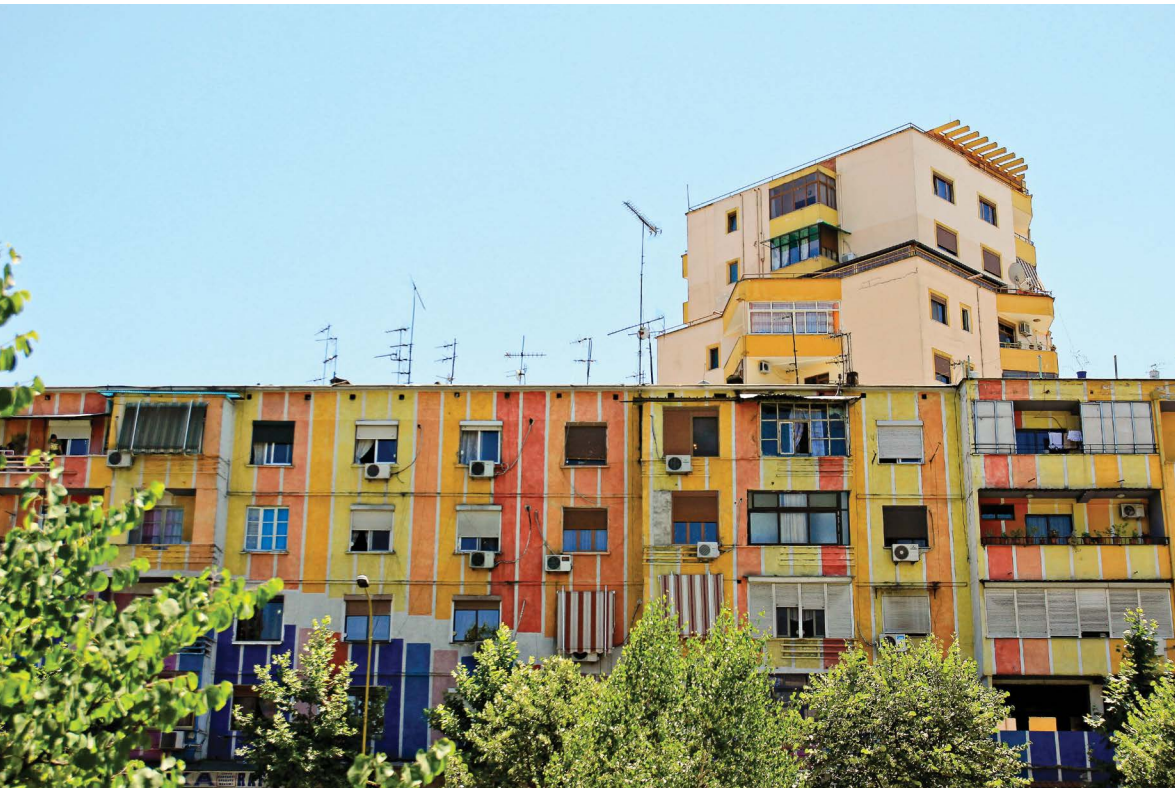
Los milagros de una simple capa de pintura fresca. Edificios de la era Soviética en Tirana son transformados para mostrar al mundo una nueva Albania.

han sido difíciles de implementar debido a la resistencia de grupos de interés arraigados que temen perder sus privilegios; sin embargo, en Albania, muchas de estas medidas se iniciaron durante el primer año como miembro del FMI. Esto se originó en parte por el fracaso tan exhaustivo del régimen anterior. El pueblo estaba preparado para una nueva dirección. Por otra parte, el apoyo público creció por la asistencia del FMI y del Banco Mundial en