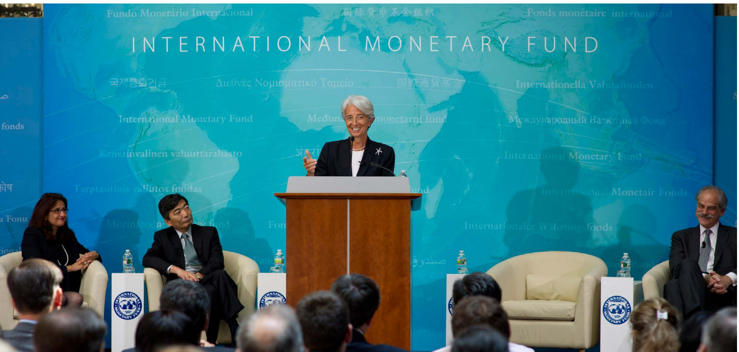
Cuba es uno de solo ocho países en el mundo que no son miembros del FMI, encabezado por Christine Lagarde. (Arriba)

lecciones para Cuba. Albania, que se incorporó al FMI en octubre de 1991, posee algunas similitudes interesantes. El primer préstamo que el Fondo le otorgó a Albania se aprobó en agosto de 1992. Su reinserción en el sistema financiero mundial y las reformas consecuentes produjeron mejoras significativas en la calidad de vida. Vietnam ofrece otro ejemplo positivo, esta vez con la adhesión a las IFI después de un período de reforma inicial. En ambos países, mejoró desde el PIB hasta indicadores sociales como la esperanza de vida al nacer. Tales experiencias internacionales satisfactorias pueden actuar en favor de los consensos en Cuba en relación a tal decisión.