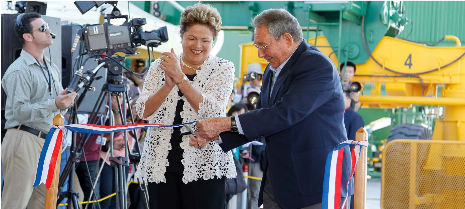
La presidenta de Brasil, Dilma Rousseff, inaugura el Puerto Mariel, financiado por Brasil, con el presidente Castro. Cuba espera que se convierta en el puerto con volúmenes más grandes del Caribe.

nivel en 1990 y el deterioro de los pilares del modelo socialista (servicios sociales, de salud y educación) han creado una ventana de oportunidad para debatir e implementar nuevas propuestas.