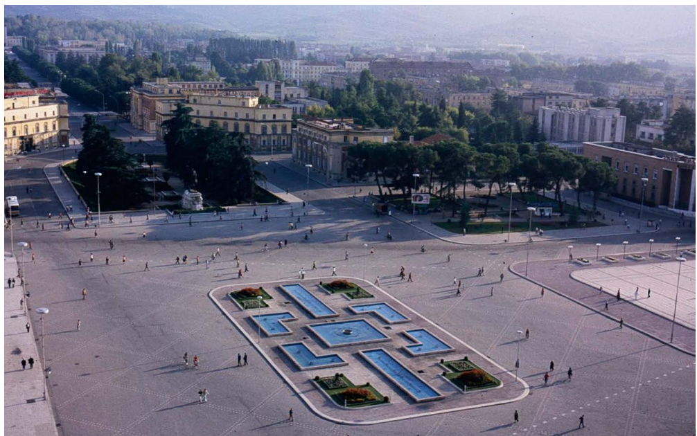
La plaza Skanderbeg en Tirana, la capital de Albania, se transformó significativamente desde 1988, a medida que Albania comenzaba a entrar en la economía global.

Cuando Albania se unió al FMI en octubre de 1991, no solo buscaba apoyo financiero sino también asistencia en el diseño de las reformas económicas. Para cumplir con los requisitos de adhesión al FMI, Albania tuvo que superar tres obstáculos: las debilidades de sus instituciones y base estadística; la