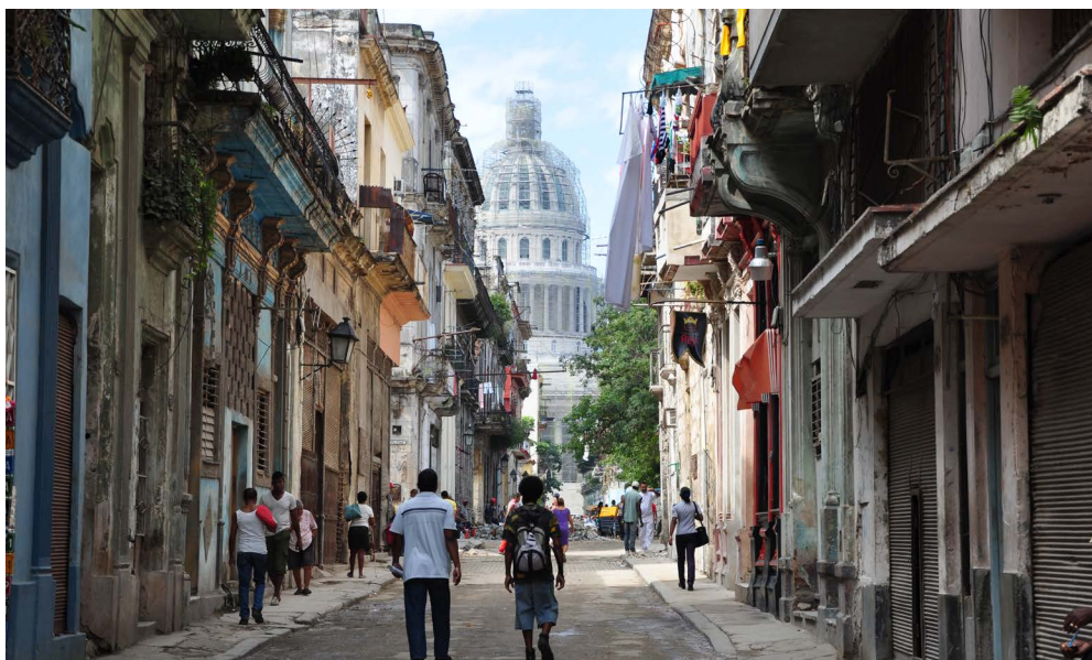
El nuevo proyecto del gobierno cubano de renovar El Capitolio señala uno de los muchos cambios potenciales que Cuba persigue para crear una nueva imagen internacional.

Otras tres disposiciones de la legislación estadounidense dificultan la admisión de Cuba en las IFI o la financiación desde las mismas. En primer lugar, la Ley de protección de las víctimas del tráfico y la violencia de 2000 clasifica a los países según su adherencia a procedimientos y normas contra el tráfico de personas, y estipula que el Presidente debe instruir a los Directores Ejecutivos estadounidenses de las IFI a votar en contra de préstamos multilaterales para los países de la Fila 3, considerados como los países de peor desempeño. Cuba actualmente está clasificada como un país de Fila 3. Esta ley no parece ser un obstáculo insuperable, ya que la inclusión de Cuba en la lista de la Fila 3 se basa en que no presenta informes detallados de sus acciones contra la trata de personas a las autoridades de EE. UU.; un legado