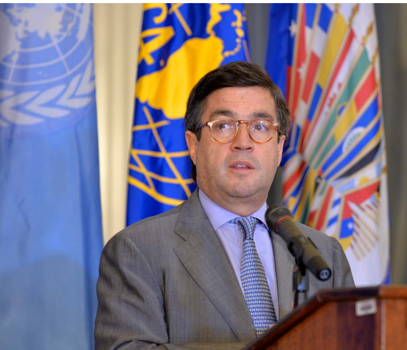
Luis Alberto Moreno, el presidente del Banco Interamericano de Desarrollo, ha discutido un posible plan para que Cuba se una a dicha institución.

El gobierno ha reconocido que necesita más inversión extranjera. En 2014, con la esperanza de atraer unos $8 mil millones de dólares en capitales internacionales, se introdujo una nueva ley de inversión directa extranjera, se inauguró la “Zona Especial de Desarrollo” en el puerto del Mariel y se presentó un portafolio con diferentes propuestas para recibir inversiones foráneas. Aunque las propuestas planteadas aún deben materializarse, es evidente el creciente interés de empresas extranjeras por tales oportunidades. El factor que ha desencadenado esta renovada atención es claramente el acercamiento con Estados Unidos. 2