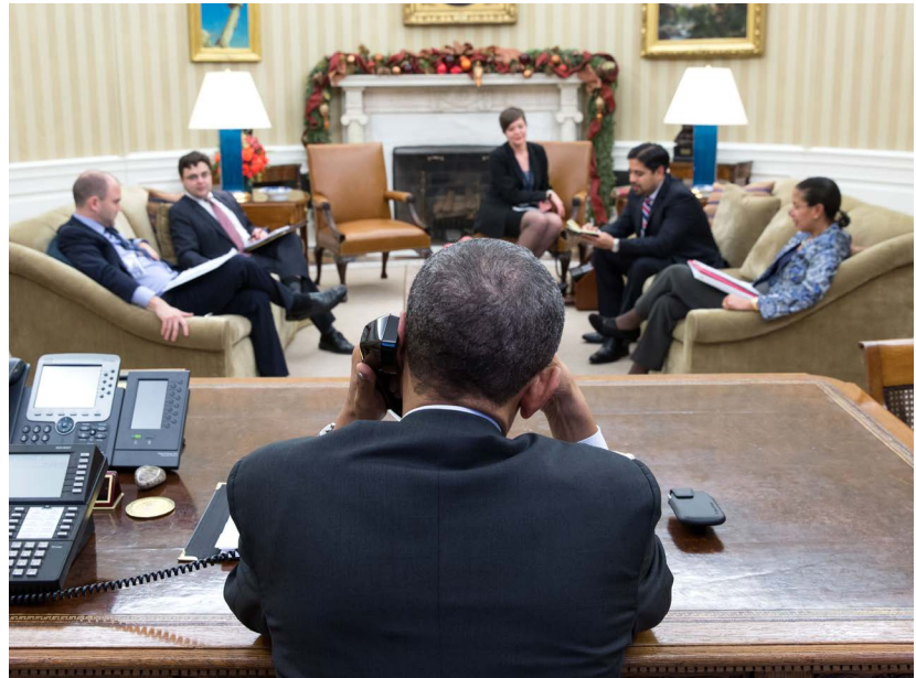
El presidente estadounidense Barack Obama habla por teléfono con el presidente cubano Raúl Castro el 16 de Diciembre del 2014, un día antes del anuncio sobre los históricos cambios de política hacia Cuba.

Ahora que ha crecido el interés por Cuba de los inversionistas extranjeros y de la comunidad internacional parece ser un buen momento para retomar el debate sobre la reinserción de Cuba en la economía mundial. Tal y como ha ocurrido con otros países, un primer paso crítico es recuperar el acceso a las instituciones financieras internacionales (IFI), especialmente el Fondo Monetario Internacional (FMI), el Banco Mundial y el Banco Interamericano